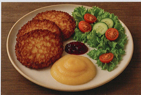
Reibekuchen mit Apfelmus und frischer Salat mit Dressing